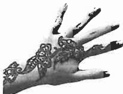
Fig.2 Tatuaje a base de Henna negra

En los últimos años se ha observado que en algunos casos se ha utilizado Henna negra para la realización de este tipo de tatuajes temporales, con lo que se consigue un dibujo sobre la piel de color negro brillante, más atractivo y duradero que con la Henna natural.