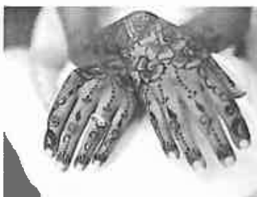
Fig.1 Tatuaje a base de Henna natural

La Henna natural se obtiene de las hojas y flores de un arbusto. El polvo que se obtiene de ellas es mezclado con distintos productos para formar una pasta de color marrón verdoso. Esta pasta debe estar en contacto directo con la piel tanto tiempo como sea posible para conseguir un tatuaje temporal de color rojo castaño, que durará sobre la piel unos tres o cuatro días.