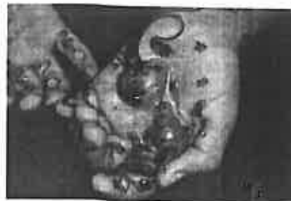
Fig.3 y 4 Reacciones de sensibilización por Henna negra